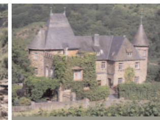
Kesselstatt: Bekannt für gute Weine

Tel. 02672/ 91 06 06 www.weinkultur-reisen.de