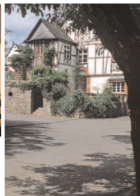
Clemens Busch: Bio-Winzer