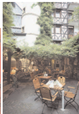
„Doctor Weinstuben“: Rustikal