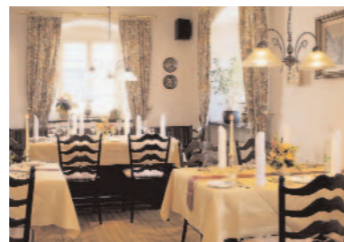
Conrad: Mit Restaurant „Brauneberger Hof“

Moselstr. 7–9 54349 Trittenheim Tel. 06507/ 23 00 milz@milz-laurentiushof.com Wer nach dem Genuss der trockenen Spätlese vom Trittenheimer Leichterchen fällt, kann sich mit einem Kabinett aus der Trittenheimer Apotheke verarzten lassen.