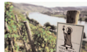
Vereinigte Hospitien: Top-Gut in Trier

Alte Marktstr. 2 56841 Traben-Trarbach Tel. 06541/ 94 70 www.muellen.de Die hervorragende Riesling Spätlese aus dem Kröver Paradies trägt nicht umsonst den witzigen Zusatznamen „Jippi“.